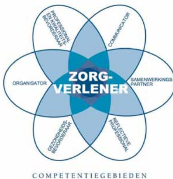
Figuur 1. CanMEDS-systematiek

In de inleiding van dit document is te lezen dat het Expertisegebied longverpleegkundige beschouwd dient te worden als een aanvulling op het beroepsprofiel van de verpleegkundige (Lambregts & Grotendorst, 2012). Het beroepsprofiel beschrijft de elementen van het beroep die voor elke verpleegkundige van toepassing zijn en ook voor de verpleegkundigen die binnen het Expertisegebied werkzaam zijn. Om de verbinding tussen het beroepsprofiel en het Expertisegebied duidelijk te maken, komen de hoofdpunten van kennis en vaardigheden uit het beroepsprofiel terug in dit Expertisegebied. Vervolgens worden, naast deze basis, de aanvullende kennis en vaardigheden van de longverpleegkundige beschreven. Dit alles is uitgewerkt aan de hand van de CanMEDS-systematiek (Canadian Medical Education Directions for Specialists). Deze systematiek bestaat uit zeven verschillende rollen. De kern van de beroepsuitoefening is de verpleegkundige als zorgverlener. Alle andere rollen expliciteren de centrale rol en refereren eraan. De rol van zorgverlener geeft richting aan de andere CanMEDS-rollen.